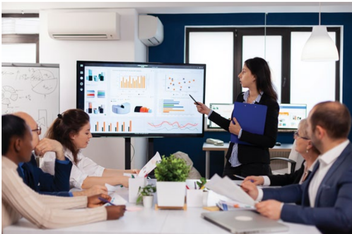
La fotografía hace parte del diseño y no de empresa colombiana líder en la industria de alimentos y aseo

En la actualidad, cuenta con presencia en mercados internacionales y de consumo fuera del hogar. Dentro de su estrategia tecnológica de innovación de negocio se dieron la tarea de buscar una solución de infraestructura flexible que les ayudara a optimizar sus recursos y aprovechar las ventajas de tenerla en la nube, con la expectativa de un mayor rendimiento, llevar a cabo la estrategia tecnológica de innovación a un precio justo constituyéndola en una apuesta sostenible a mediano y largo plazos.