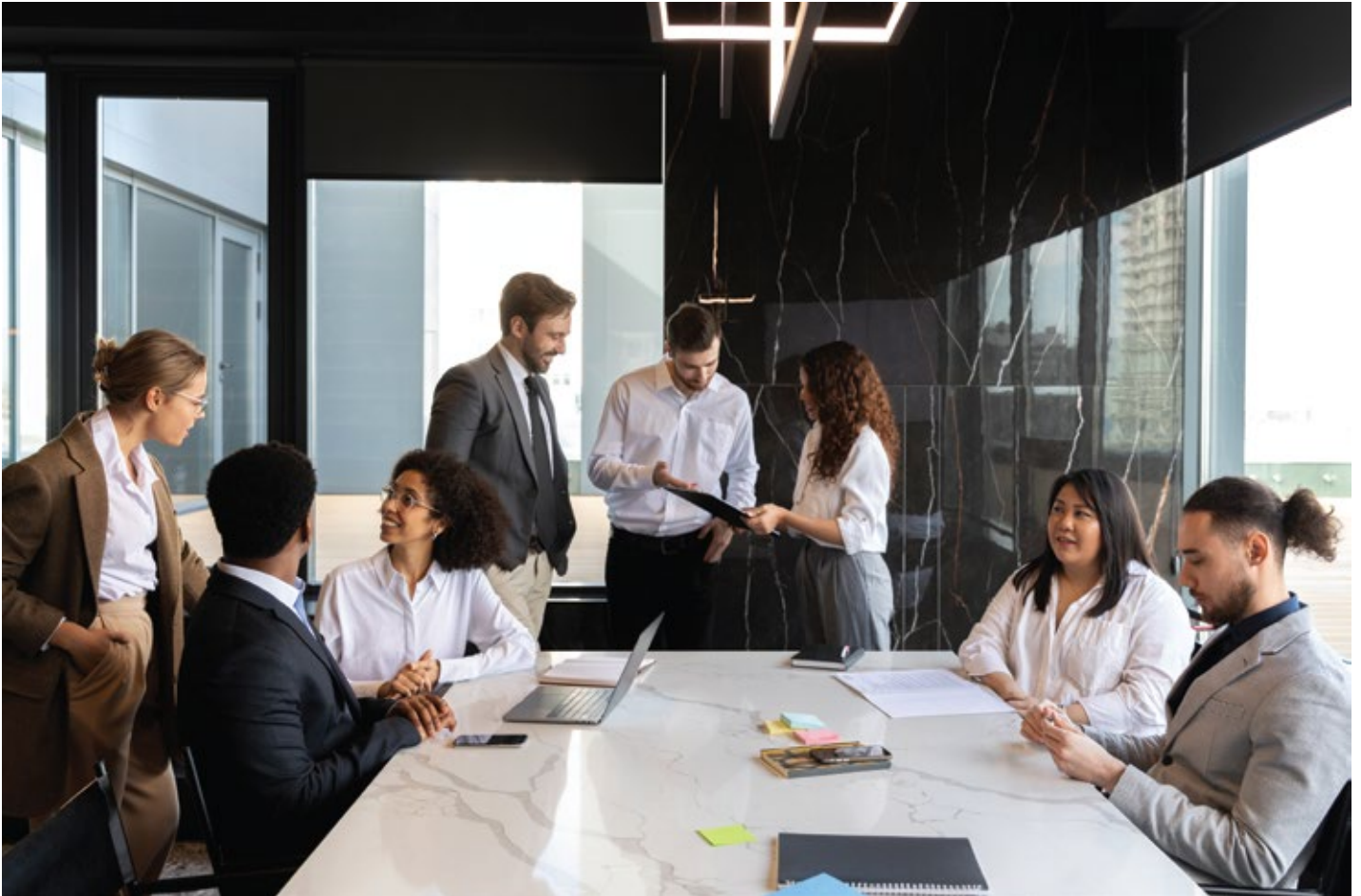
La fotografía hace parte del diseño y no de New Stratus Energy Ecuador

New Stratus Energy Ecuador es una empresa pública canadiense enfocada en la exploración, desarrollo y producción de petróleo y gas natural en América Latina.